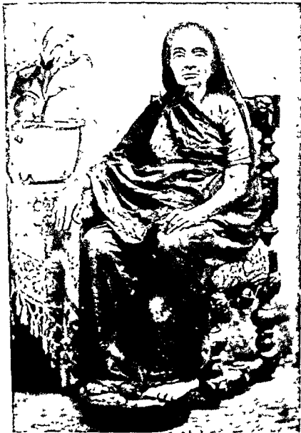
श्री. आशीषान्न वसनल भुगीवाणा २२ नोव्हेंबर :- सं. १९८४ ना अ. १४८ मूर १३